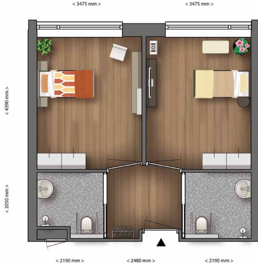
Voorbeeld van twee gespiegelde zit-/slaapkamers. Aan de afmeting en indeling kunnen geen rechten ontleend worden.

U heeft zelf de regie over uw daginvulling. De zorgmedewerkers ondersteunen u daarbij. Voor al uw vragen kunt u aankloppen bij uw eigen contactpersoon op de afdeling. Zij is uw eerste aanspreekpunt bij vragen over de zorg en daginvulling binnen De Reggevaart.